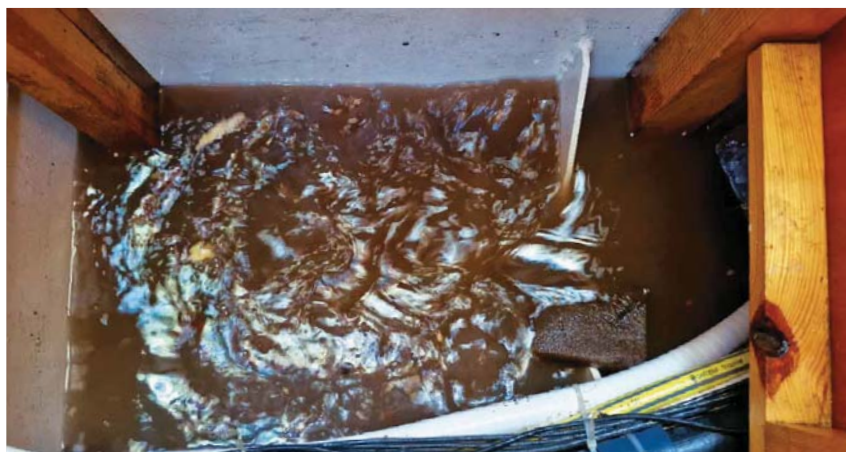
Pod podlahou v kuchyni se objevilo docela velké množství vody.

Probudím se do slunečného rána, kolem je laguna s čistou a už teplou vodou. Okamžitě si jdu zaplavat, protože to mi chybělo již půl roku. Pak se přesunu s dinghy na břeh prozkoumat vesnici. Na stanici gendarmerie slouží policistka, tak se zkusím přihlásit. Ta to zjevně ještě nikdy nedělala a pořád někam telefonuje a vyptává se. Nakonec mi po hodině čekání sdělí, že se musím nejdříve online zaregistrovat na stránkách celníků a potom mě může teprve přihlásit. Je to nějaká novinka, která při mé poslední plavbě ještě nefungovala. Takže se projdu po okolí, utrhu dva kokosy a vrátím se na loď, kde se přes Starlink při-