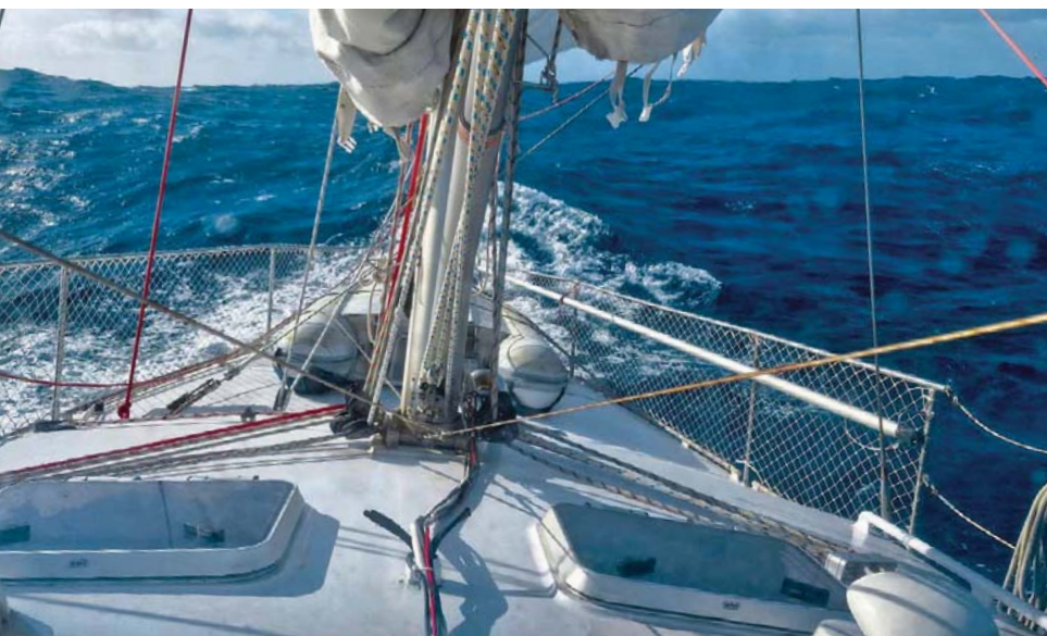
Během plavby se SNĚHURKA musela vyrovnat s poměrně velkými vlnami.

malou genou. Motor totiž pomáhá proudem vody na kormidlo lépe a rychleji srovnat SNĚHURKU do správného kurzu. I tyto větší vlny se nechají dobře splouvat a krom toho potřebuji stejně dobíjet baterie, protože už několik dní chybí slunce na nabití přes solární panely.