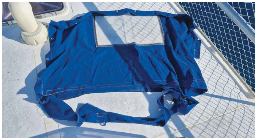
Roztrhaná krycí plachta kokpitu vyžaduje opravu.

krát ještě silnější. Hlášený vítr 40 uzlů, poryvy do 45 uzlů a vlny šestimetrové. Toho se nechci moc účastnit, takže měním kurz na čistý sever a pokračuji takto celé dva dny s plánem bouři ujet. Ta by mě měla při tomto postupu lehce minout za zádi. Třetí den se již vítr opět zvedá na hlášených 40 uzlů a zase nastává boj s vlnami. Gena je vypuštěná jenom na menší polovinu a vlny způsobují ještě větší kolébání než předchozí bouře. Ale SNĚHURKA drží dobře směr a autopilot stále funguje bez komplikací. Ležím v salonu, kde mám přehled nad přístroji, a občas vylezu do kokpitu na kontrolu. Celý kokpit mám uzavřen chránicí plachtou, takže dovnitř necáká vodní tříšť od vln a ani vítr se sem nedostane. Mám rád suchou plavbu a šturmáky