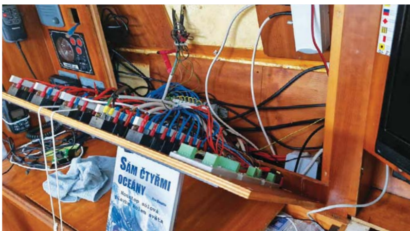
Bylo nutné co nejdříve vysušit především rozvody elektroinstalace.

Doplul jsem tedy do nejkrásnějšího místa na zeměkouli, kterým je právě Francouzská Polynésie. Dám si ještě jedno kolečko po známých ostrovech a příští rok opět na západ. Na nepříjemnost s velkou vlnou na oceánu brzy zapomenu, bylo to poprvé za osmnáct let plavby a v podstatě se nic tragického nestalo. Několik přístrojů se opraví nebo vymění a SNĚHURKA bude v plné kondici připravena na další dobrodružství.