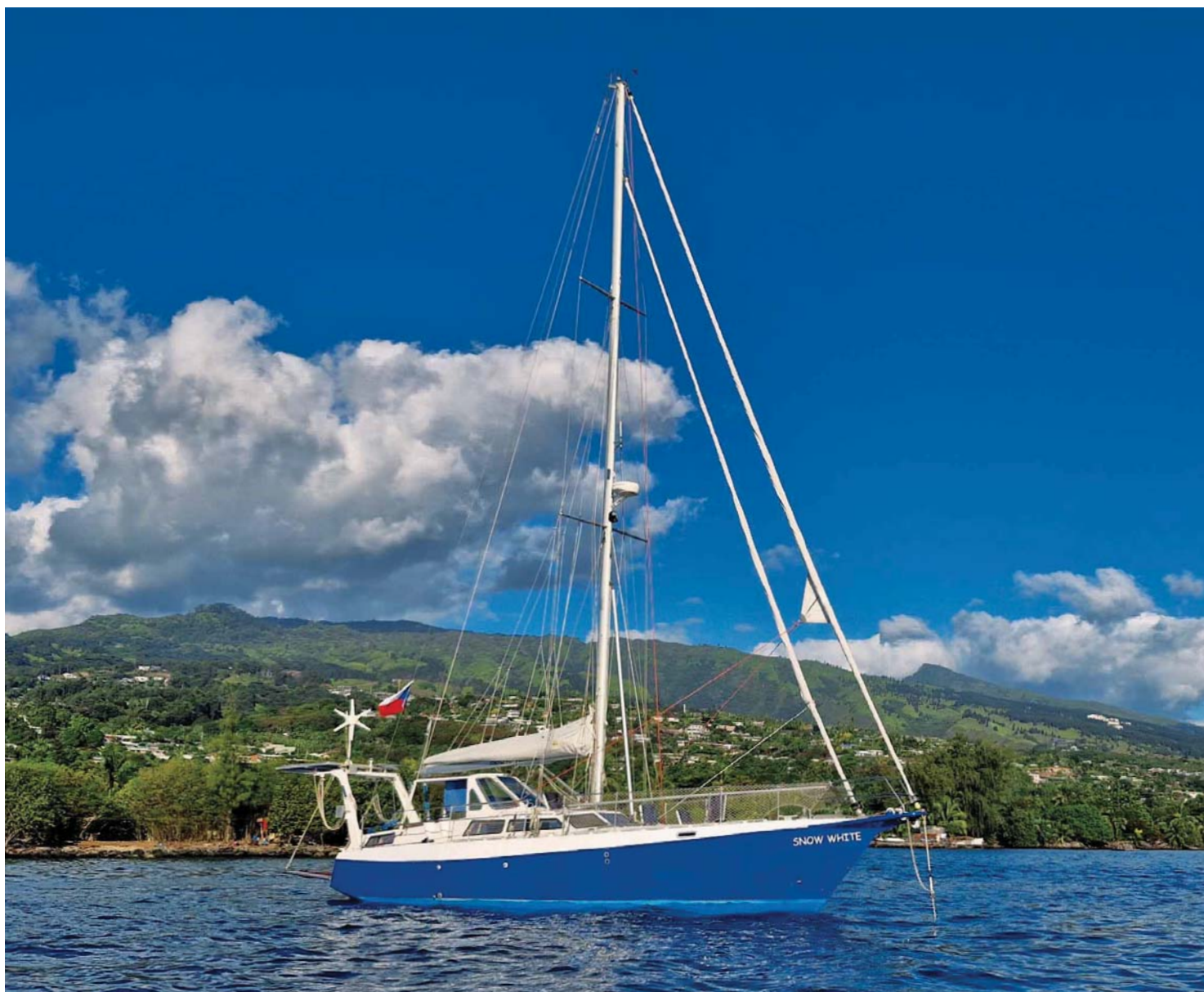
SNĚHURKA na kotvě u pobřeží ostrova Tubuai