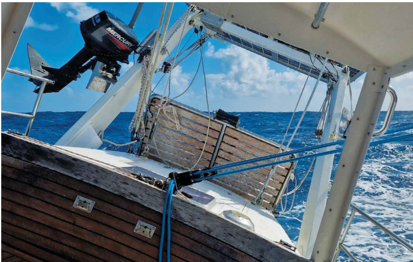
Kokpit bez stínících plachet, které roztrhala bouře, působil nezvykle.

hlásím na web. Další den už s touto registrací dostanu do pasu razítko a papír s přihlášením, ale s tím pak stejně ještě musím na hlavní celnici v Papeete.