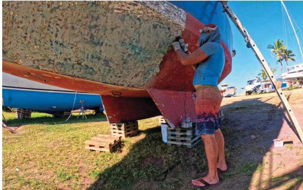
Broušení není zrovna moje oblíbená činnost.

Pak je již čas vyplout. Nejdříve jsem zamířil čtyřicet mil na východ. Dnes naštěstí nefouká, takže si na klidné hladině motoruji do zátoky Rainbow reef. Hned po ránu na začátku plavby jsem