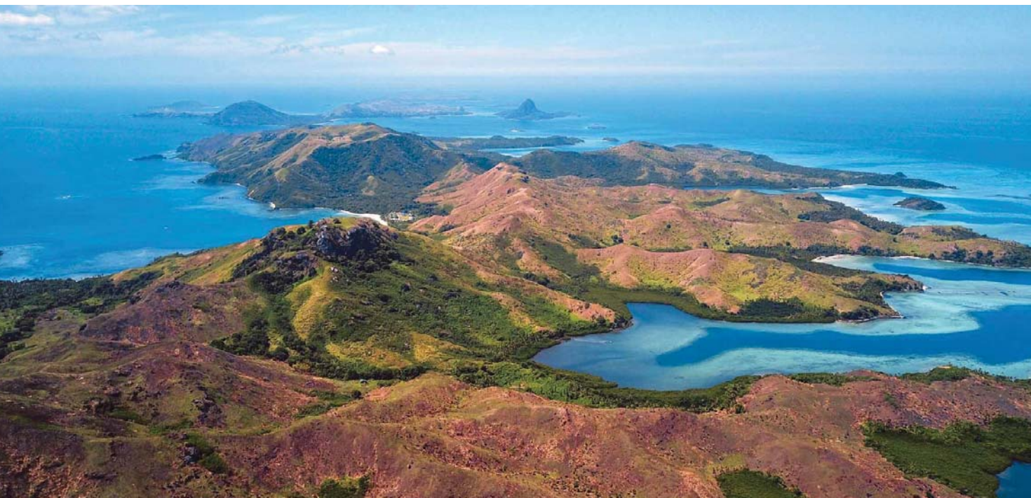
Skupina ostrovů Yasawa

Desátého listopadu ve čtyři hodiny odpoledne se vyvazuji u celního mola v marině Opua. Vítr fouká od mola, takže mám problém se k němu dostat a žádná pomoc se nenabízí. Asi na pátý pokus se mi podaří docouvat k molu a pak mám jediný pokus na to vyskočit s lanem v ruce na molo a rychle ho uvázat. Pokud to neudělám dostatečně rychle, tak to SNĚHURKU odfoukne od mola a v nedaleké marině způsobí katastrofu. Naštěstí se vše podařilo a prostřední lano jsem uvázal. Při pohledu na zád' na mne jdou mrákoty. Loď se zastavila asi třicet centimetrů od silného sloupu držícího molo. Mám tam dozadu přesahující solární panely a ty by to pěkně zmáčklo. Rychle ještě uvážu přední i zadní lana a mohu si oddychnout. Za chvíli připlouvá na člunu celník a pracovník biosecurity. Pro celníka mám již připravený vyplněný formulář a během dvaceti minut má vše hotové a je spokojen. Pracovník biosecurity zatím kontroluje tyčí s GO PRO kamerou trup pod vodou. Je maximálně spokojený, protože nikde ani kousek řasy. Pak prohlédne celou loď uvnitř a hledá mravence či jiné potvory. Nakonec zkontroluje potraviny a vše je v pořádku.