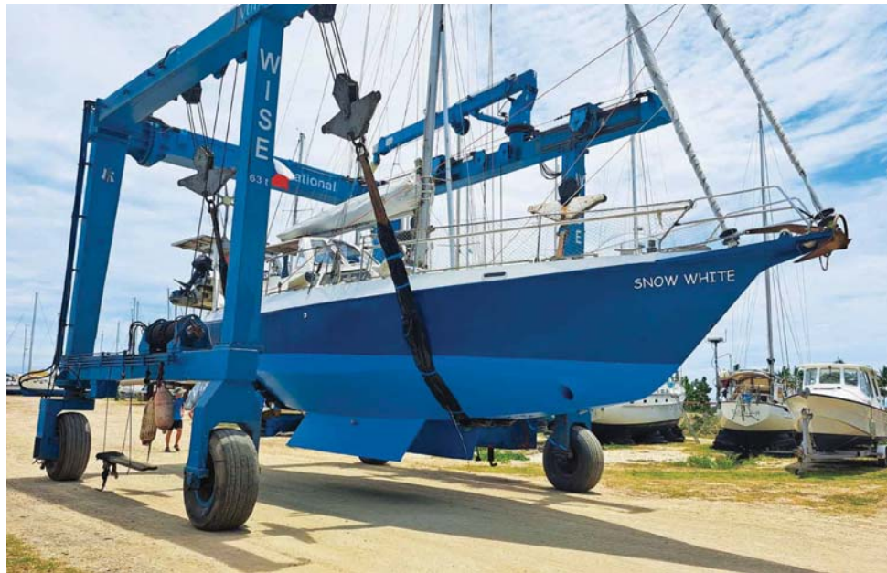
SNĚHURKA po údržbě v marině

Je konec října a na západě na ostrovech Vanuatu se již utvořil první letošní hurikán. Naštěstí je jeho dráha směřována směrem na Nový Zéland, kde ovlivní počasí na několik dnů. Je to však jasné znamení, že je čas na přeplavbu. Stojím tedy v zátocě a sleduji předpověď počasí v očekávání větrného okna na plavbu na Nový Zéland. Vtipné je to, že odhlášení z Fidži je třeba avizovat dva dny dopředu a to se samozřejmě zase vše může změnit. Bude to loterie, protože na deset dnů nikdy nebude předpověď větru spolehlivá. Poslední říjnový den se odhlásím a přepluji na blízky ostrov Musket Cove, kde ještě zůstanu na noc, a ráno chci vyplout na jih.