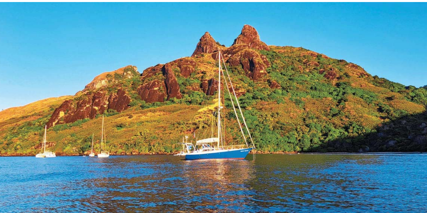
SNĚHURKA na kotvě u ostrova Waya

Levu. Zde je mnoho dobře chráněných zátok a v jedné z nich leží rezort Volivoli, kde se chci potápět, protože má dobré reference. Za dva dny jsem absolvoval pět ponorů a byl jsem na-prosto nadšen. Oproti Francouzské Polynésii tady nejsou velké ryby, ale čeká vás obrovská rozmanitost a barevnost korálů. Zatím jsem takové množství nikde neviděl. Podle příruček je Fidži místem s největším výskytem měkkých korálů na světě.