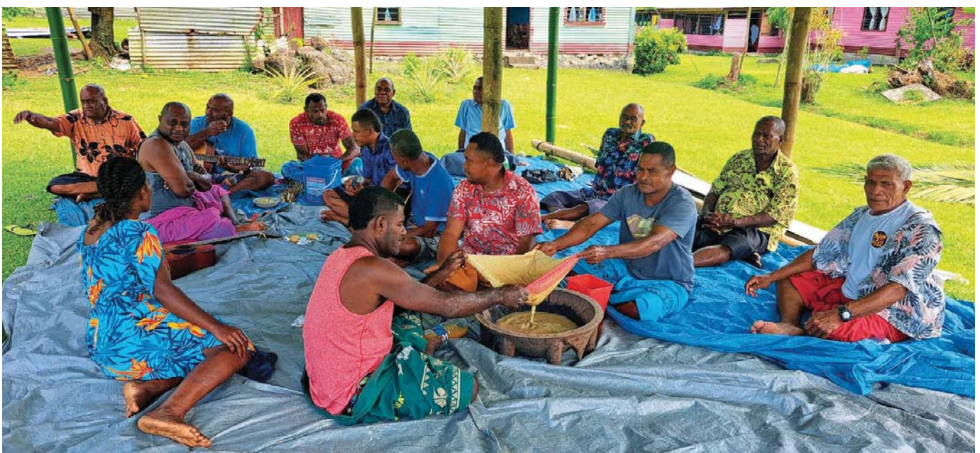
Rituál popíjení kavy

S příjemným silicím větrem jsem přeplul čtyřicet mil na severní pobřeží hlavního ostrova Viti