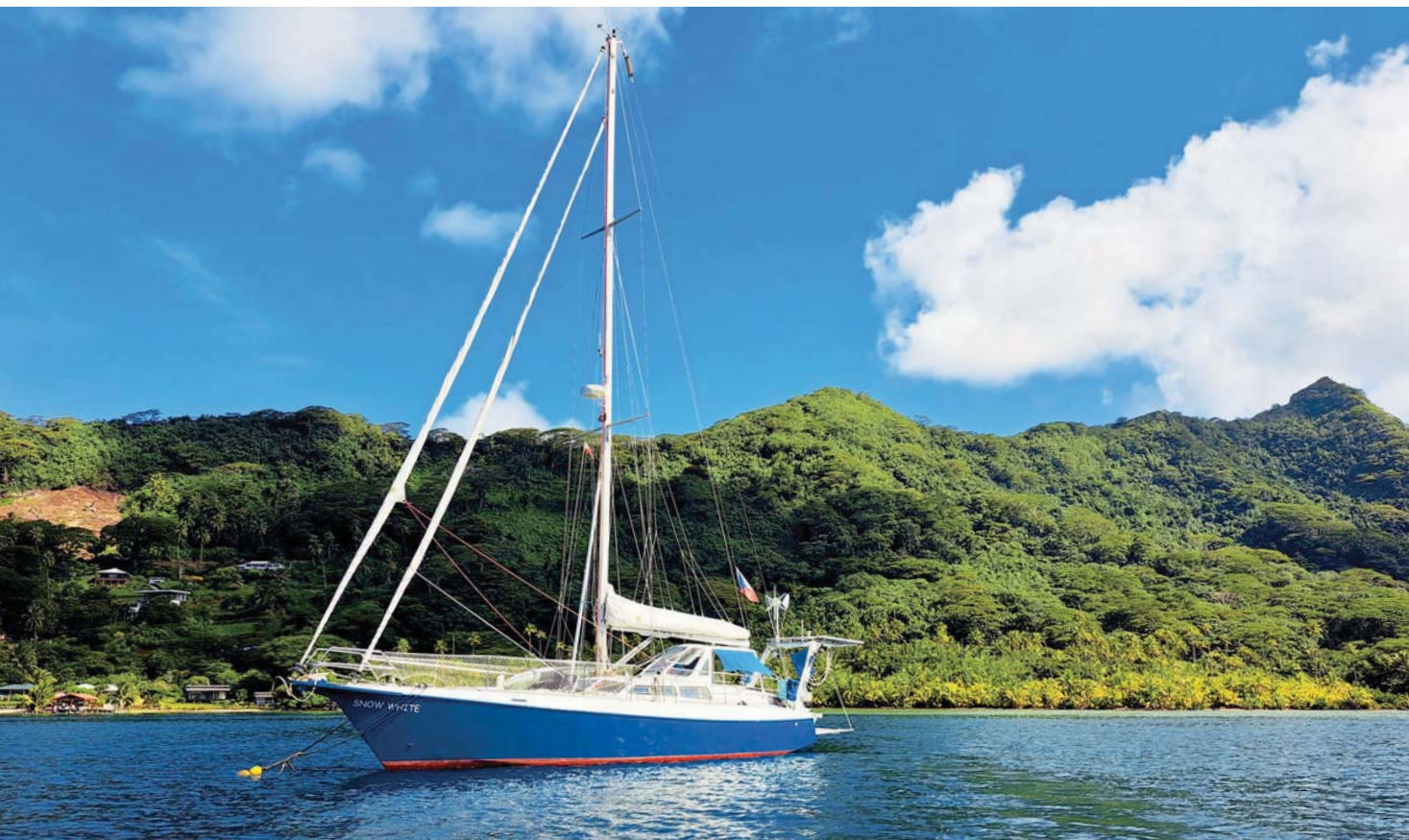
SNĚHURKA na kotvě u ostrova Huahine

S amozřejmě jsem navštívil i zátoku Mata-vai, kde poprvé přistál James Cook a na blízkém mysu postavil pozorovatelnu na sledování Venuše. Rovněž zde kotvil poručík Blight se svou BOUNTY, na niž nakládal saze-nice chlebovníků. V polovině ledna se konečně otočil vítr, takže vyplouvám na severovýchod na Tuamotu. Tyto ostrovy mě tak uchvátily, že se tam ještě musím vrátit, protože takovou krásu asi již nikdy neuvidím. Prvním kotvištěm je opět atol Fakarava, kde je nejkrásnější potá-pění, co jsem zatím zažil. Znovu si užívám pobyt pod vodou se stovkami žraloků a skvěle je zde i šnorchlování. Po dvou týdnech stráve-ných většinou pod vodou vyplouvám opět na západ a kopíruji pobřeží dalších atolů. Na Rangiroře se opět potkám s Michalem, který zde žije, a zase máme mnoho společných chvil nad i pod vodou. Posledním atolem je povinná zastávka na Tikehau, kde je čistící sta-nice mant, a tentokrát se mi tito krásní tvorové ukazují ze všech stran. Dosud nikdy jsem neza-žil takové sblížení s těmito tvory.