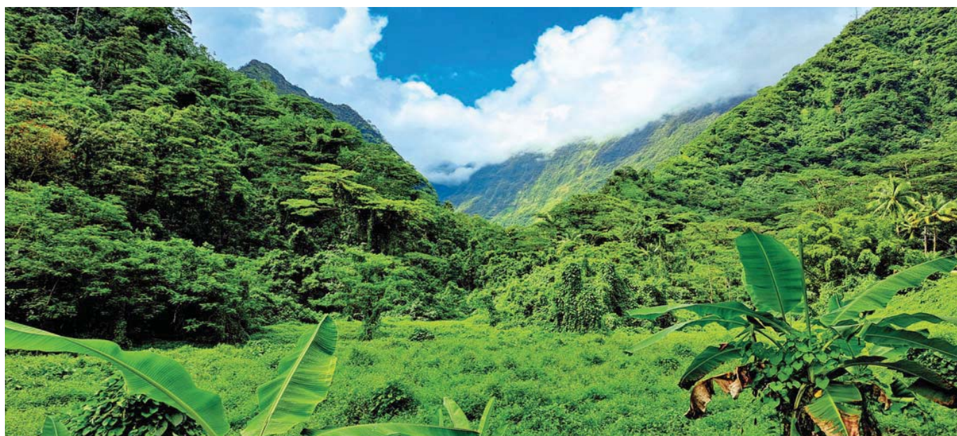
Na Tahiti je ještě mnoho míst s úchvatnou neporušenou přírodou.