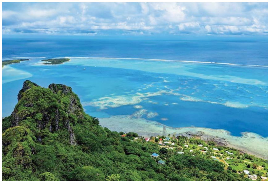
A podobný výhled na část korálového věnce okolo ostrova Maupiti

Bora Bora je určitě nejnámější ostrov v Polynésii, kam to je dalších pětadvacet mil plavby. Podle prospektu vím, že je zde možné kotvit díky omezením pouze na čtyřech kotvištích a musí se používat pouze mooringy za poplatek 4000 XPF, což je asi 800 Kč za noc. Postupně využiji všechna kotviště a podniknu výšlap na zdejší vrchol, který je opravdu náročný a místní hotely jej vůbec nedoporučují pro turisty. Výhled na lagunu je však fascinující, obzvláště když na vrcholu potkám dvojici z Čech, která si také chtěla dopřát tento rozhled. Jinak mě ostrov nijak zvláště nezaujal a spát v místním bungalovu nad vodou za cenu 1 500 EUR na noc mě opravdu neláká.