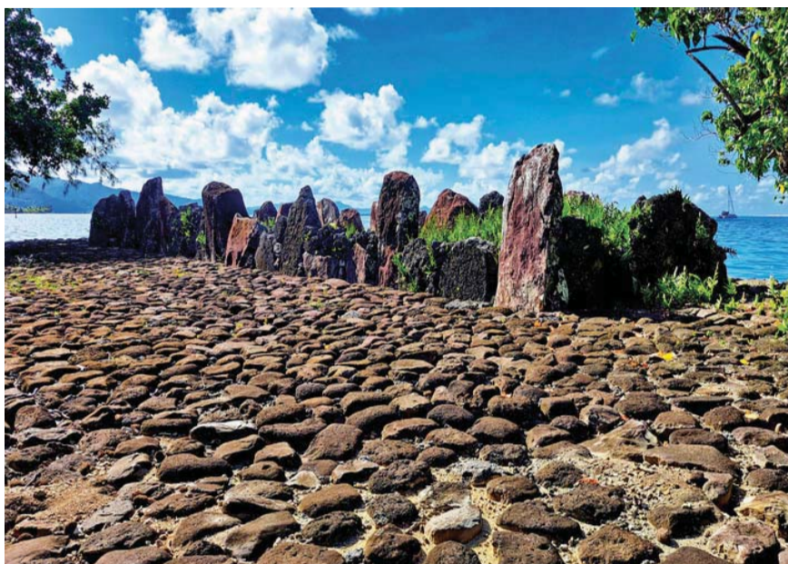
Kamenné pole posvátného místa marae

drahé a ceny baterií jsou nehorázné. Naštěstí s pomocí místních přátel se dozvím, že lokální firmy montující solární systémy na domy mohou prodávat baterie bez daně, takže jsou značně levnější. Po několika výletech a nacho-