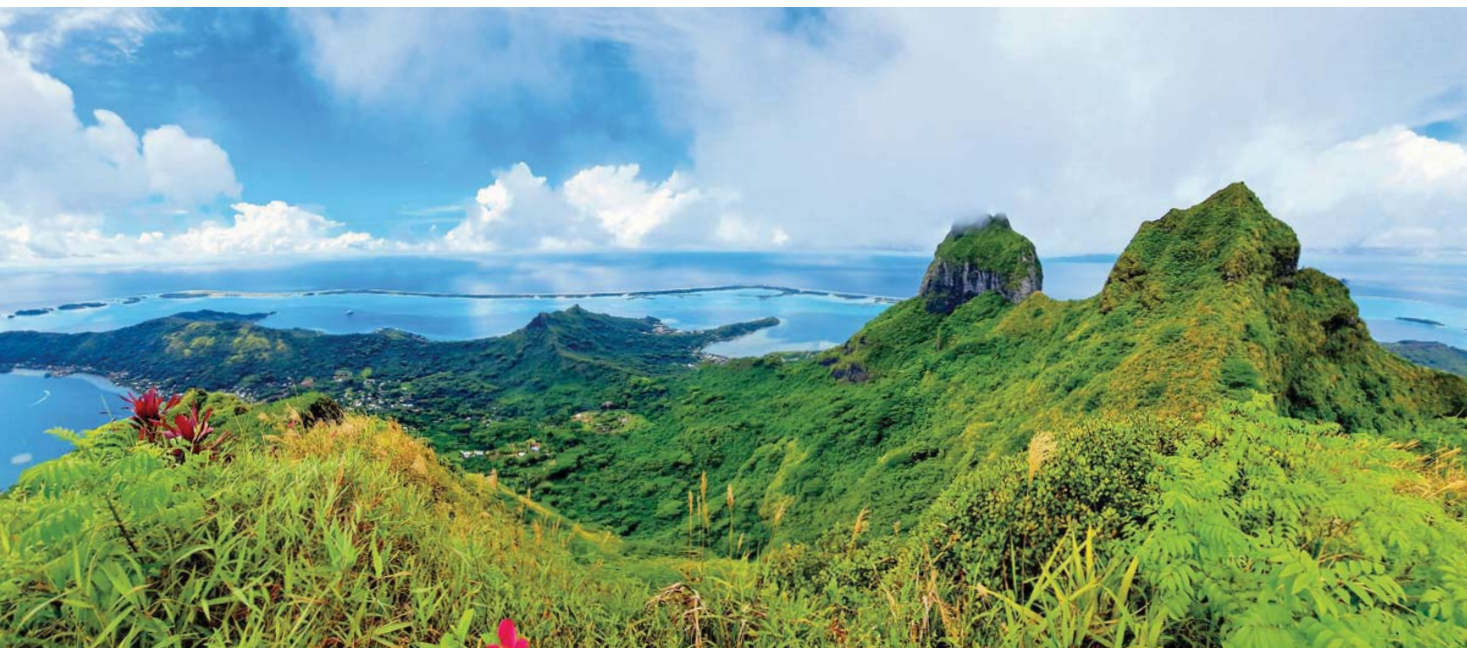
Výhled z vrcholku ostrova Bora Bora

Faie ústí do moře řeka, ve které žijí posvátní úhoři. Jsou asi metr dlouzí a silní jako paže. Schovávají se pod kameny, ale jakmile jim něco hodíte, tak nastává boj o každé sousto.