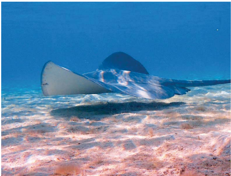
Manty je možné na atolech Polynésie pozorovat z lodí i během potápění nebo šnorchlování pěkně zblízka.

Po opravách vyplouvám konečně 16. března z Tahiti na západ. Na blízký ostrov Moorea je to pouze sedmnáct mil. Zakotvím v zátoce Jamese Cooka. Tento ostrov je velmi fotogenický a protože jeho vysoké vrcholy vyložené lákají na výšlap. Těch jsem zde udělal několik a vždy to byl super zážitek se skvělým výhledem na celý ostrov. Navštívil jsem Juice factory, jejíž součástí je i ochutnávka rumu. Kotviště na západě ostrova jsou nádherná, malá hloubka, písek na dně a vše chráněno korálovým útesem proti vlnám. Rejnoci neustále krouží pod lodí a stále je co pozorovat.