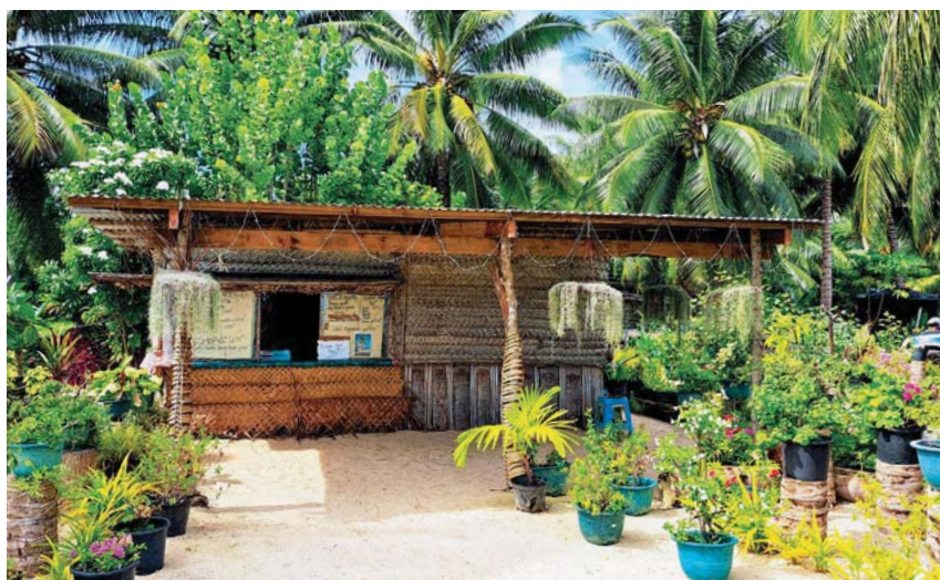
Nenápadný bar na Maupiti

Text a foto Miroslav Račan www.snehurka-yacht.cz