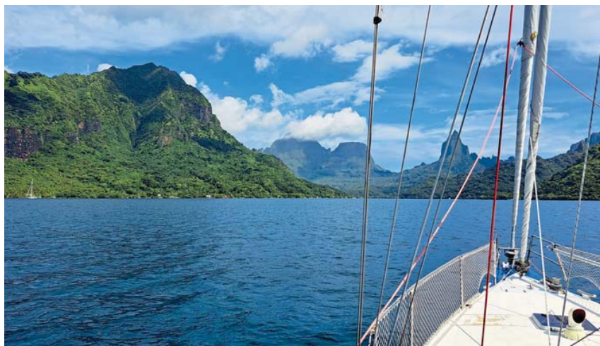
SNĚHURKA se blíží k ostrovu Moorea.