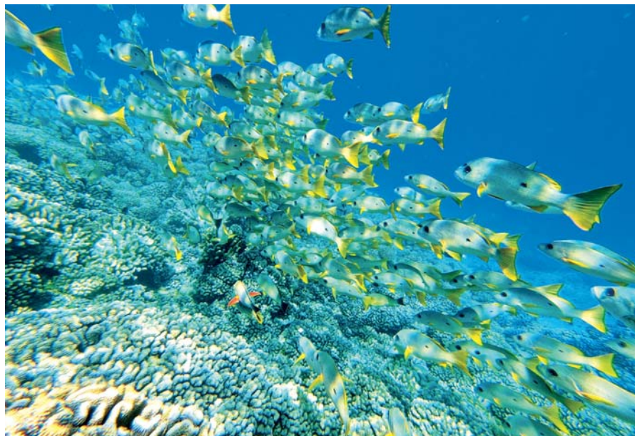
Podmořský svět na Fakaravě

tava. Zde je letiště, několik malých a drahých hotelů a hlavně obchod, protože už potřebuji doplnit zásoby. Nabídka v minimarketu je opět pouze základní, ale pro mě dostačující. Jsem smířen s tím, že ovocné hody z Markéz na delší dobu skončily.