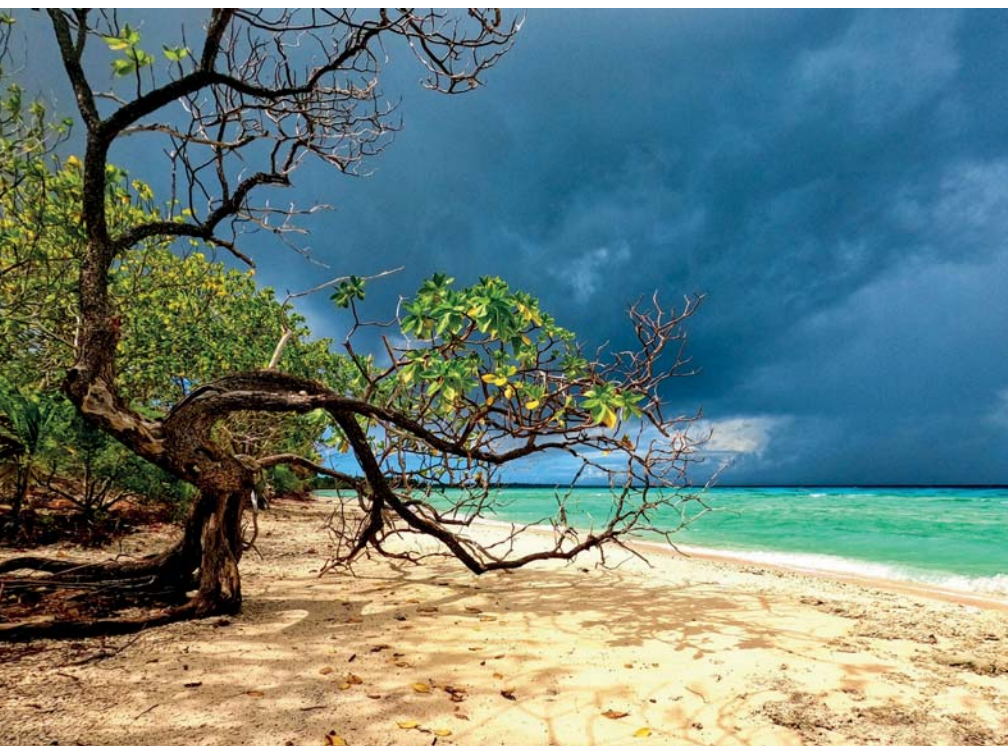
Bouřka nad atolem Makemo

pěna je všude kolem. Pod plným plynem se různě točím zleva doprava, ale postupuji dopředu. Jakmile propluji tento vařící kotel, nastávají jenom pravidelné protivlny, které pomalu zdolávám rychlostí dva uzly. Po půl hodině protiproud slábne a pomalu se rozjíždím a zatáčím na kotviště. To je dokonale chráněné před větrem palmovým prstencem a na klidné hladině spustím kotvu. Tento atol nemá v blízkosti žádné větší útesy, ale na břehu si aspoň najdu několik kokosů.