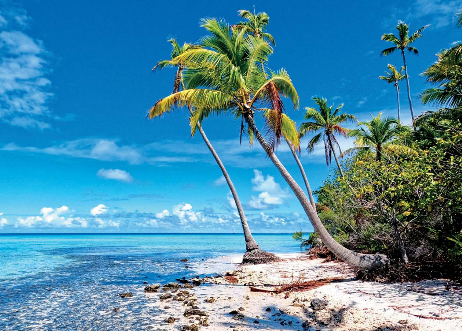
Pláž na atolu Makemo

z tuňáka. Ovoce či zeleninu nemají, protože tady rostou pouze kokosové palmy a vše ostatní se dováží lodí z Tahiti. Panuje zde mír a klid, žádný stres. U každého domku stojí velké nádrže na zachytávání dešťové vody, protože to je jediný vodní zdroj. Vodu k pití pro místní vyrábí odsolovací zařízení, kde je na malém domečku vyvedený kohout a každý si sem zadarmo dojde s kanystrem pro pitnou vodu. Elektrický proud vyrábí centrální dieselový generátor a pro domorodce je opět zdarma. Já mám samozřejmě odsolovací zařízení a vody dostatek. Na Markézách si však mnoho jachtařů jezdilo pro vodu na břeh. Tam všude byly vyvedené kohoutky na pitnou vodu a bylo jí dostatek z horských řek. Zde to však je veliký problém a pitná voda zde bude mnohým chybět.