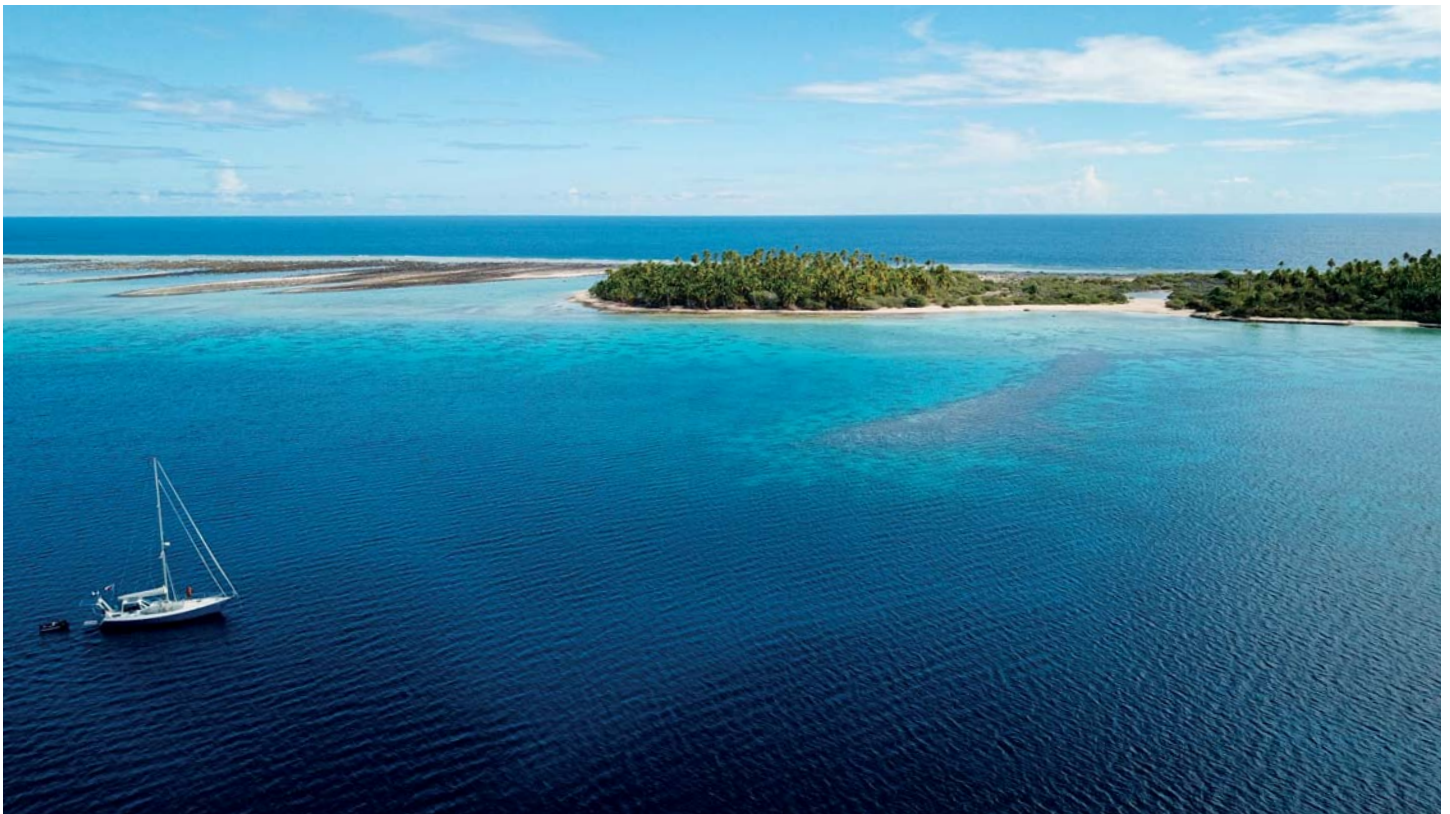
Kotviště na atolu Makemo