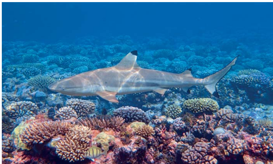
Šnorchlování na Makemo