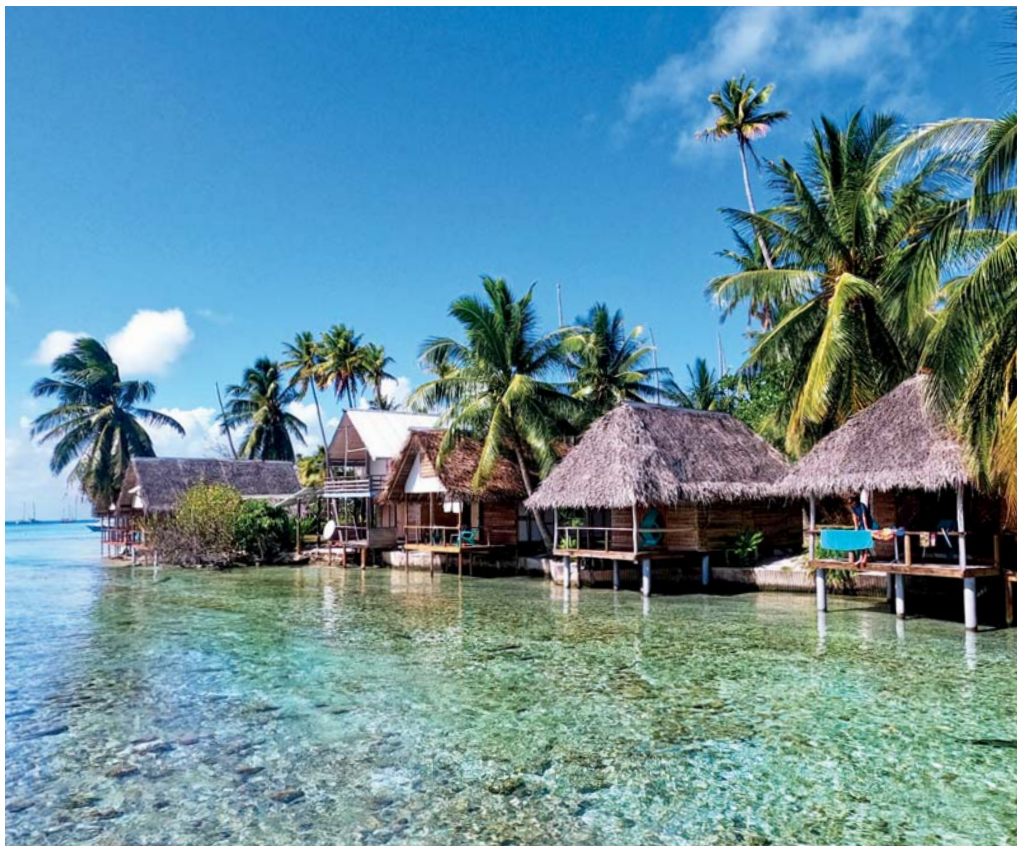
Potápěčské centrum na Fakaravé

Ráno po probuzení se však nemohu vynadivat. Čisté nebe, žádný vítr, kolem průzračná voda s viditelností dvacet metrů a kam oko dohlédne, je množství korálových útesů. Okamžitě беру snorchl a plavu k největšímu. Jakmile se přiblížím, začne kolem kroužit útesový žralok černocípý a po chvíli další a další. V podstatě neustále kolem mě krouží dva až čtyři kusy a zvědavě si mě prohlížejí. Dodržuji však pětmetrový odstup a kdykoliv se snažím přiblížit, odplují. Ti největší měří na délku asi 150 centimetrů, ti ostatní tak 120. Korálový útes je obrovský a opět velmi barevný a samozřejmě je všude kolem spousta ryb. Nesmírně si to užívám a strávím pod vodou mnoho hodin, pokaždé na jiném útesu. Stejná nádhera mě čeká i na pevnině. Kolem laguny je úzký prstenec vyčnívající nad hladinu a na něm rostou kokosové palmy. Pláž tvoří bílý korálový písek a v malé hloubce kolem třiceti centimetrů neustále krouží mladí žraloci, kteří se zde cítí bezpečně před velkými. Nějak takto si můžeme představit onen pomyslný ráj. Jenže žít tady by asi nebylo jednoduché. Natrhat kokosy je pro mě problém, protože na kmen vysoký deset