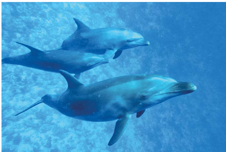
Delfíni v průlivu Tiputa

slu vplout do laguny. Přichází černý mrak se silným deštěm a větrem pětadvacet uzlů. Viditelnost je sotva na příd' a všude kolem se vaří voda s vlnami do výše kokpitu. Okamžitě otáčím a vracím se na moře, kde počkám půl hodiny, než přejde déšť. Obloha se již nevybere, ale aspoň je