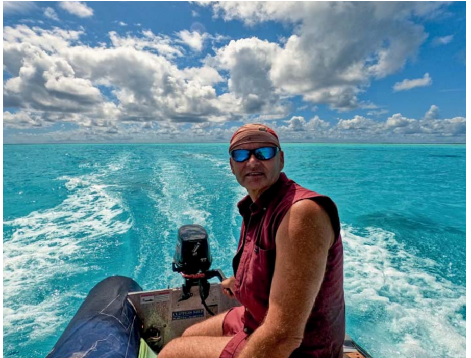
Autor na Fakaravě

Po čtyřech dnech plavby se tedy k ránu konečně blíží k atolu Makemo. Ten má podle mapy poměrně široký průliv do laguny, jsem tedy plný očekávání. Podle tabulek je právě příliv, takže pojedou s proudem a také vítr mě tlačí dovnitř. Z opatrnosti sbalím plachty a na motor se blíží k průlivu. Před ním je vidět zpěněná voda, jako když se vaří. To vlny z oceánu narážejí do proudu do laguny. Chvilí to se mnou hází a musím kormidlem rychle reagovat, abych držel směr uprostřed kanálu. Po chvilce mě uchopí čtyřuzlový proud a doslova vletím