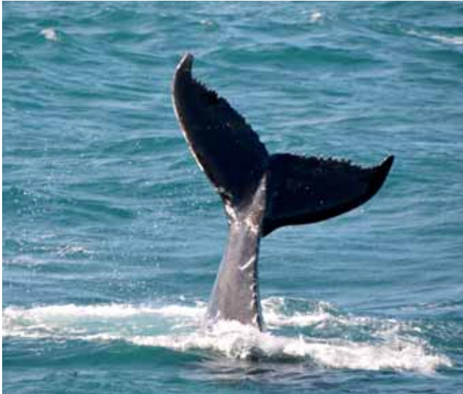
Tentokrát se mi konečně podařilo sem připlout v období výskytu velryb.