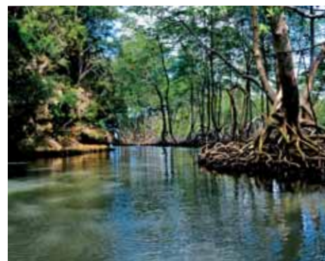
Řeka s mangrovy

dobrovolnice-fotografka velryb v jedné agentuře. Dvakrát denně vyplouvá na moře, fotografuje velryby a večer porovnává jejich charakteristické znaky jako hřbetní ploutve nebo hlavy. Existuje vědecká databáze, kde se shromažďují tyto informace a vše se potom vyhodnocuje. Vědci potom lépe poznají, kdy a kde která velryba je a poznávají tak jejich migrační plavby. Tito keporkaci tráví letní období v chladných severních vodách v okolí Newfoundlandu, Grónska a Islandu. Tam se vykrmí a v listopadu migrují do teplých mělkých vod, aby se