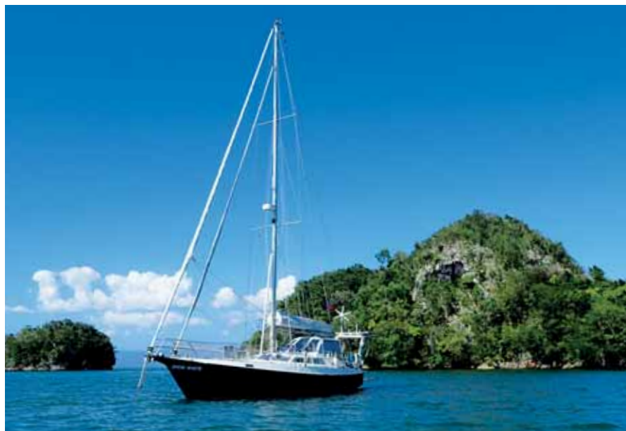
SNĚHURKA na Los Haitises

Text a foto Miroslav Račan www.snehurka-yacht.cz