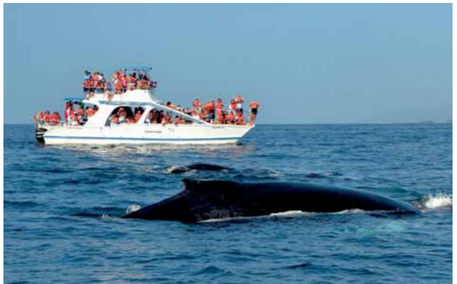
Lodě plné turistů vyplouvají na pozorování velryb.

Pokračuji tedy do přístavu města Santa Barbara, což je vlastně pouze trochu krytý záliv, a zde spustím kotvu. Odbavení je jednoduché, dojdu na imigrační, kde zaplatím 80 USD, a potom na správu přístavu, kde doplatím 30 USD za kotvení, které platí na 30 dnů po celé zátocě Samaná. Městečko je krásné, zasazené v zeleném údolí směrem k zálivu. Všude jsou vysoké kokosové palmy a Dominikánci se snaží vydělat na turistech. Nyní je právě zde díky velrybám hlavní sezona a oni si tedy potřebují vydělat na zbytek roku. Je zde několik agentur s velkými motoráky na pozorování velryb s jednotnou cenou 55 USD. Jsou opravdu vytížené a plné turistů. Já se však seznámím s Rubenem, který na ulici prodává tyto výlety pro malé lodě. Cenu usmlouvám na 35 USD a hned druhý den ráno mě Ruben veze do sousední vesnice. Zde je taková typická rybář-