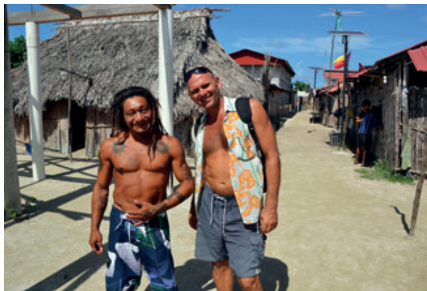
S indiánem z kmene Kuna Yala

Proto zde zakotvím SNĚHURKU a vydám se autobusem na výlet do blízké Kostariky. Ta je známá svojí přírodou a skutečně v místních národních parcích jsem si doslova užíval se svou filmovou technikou. Kostarika je neuvěřitelně