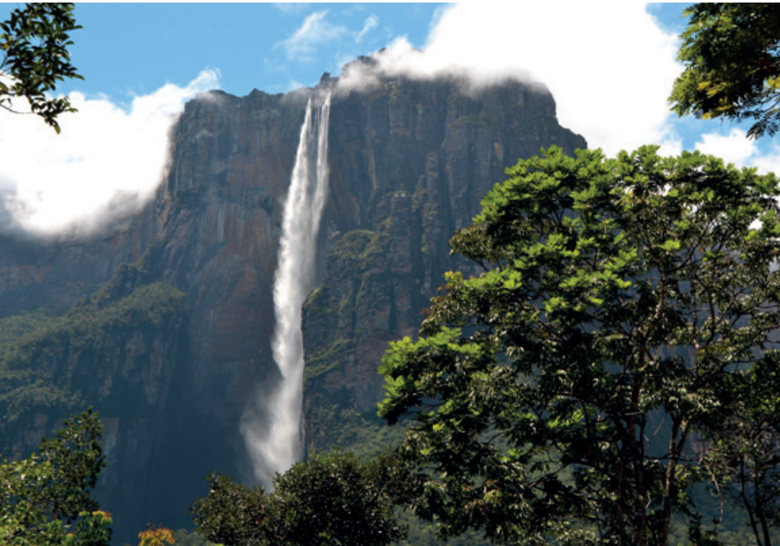
Andělský vodopád – nejvyšší vodopád světa

foulingem i novou modrou barvou na bocích a jde zpět na vodu. Marina je celá obsazená jachtaři, někteří zde stojí dlouhodobě, kvůli levným nákladům. Jídlo v restauraci s pivem za 2 USD, 4 piva za dolar, na trhu lze nakoupit čerstvé ovoce, zeleninu, maso, sýry opravdu za lidové ceny. Vše má však i druhou stranu mince. Obrovská kriminalita se podepisuje na bezpečnosti. Před vchodem do mariny je třeba stopnout taxi a vysednout z něj pouze v centru na trhu nebo u obchodů. Jakékoliv chození volně po městě se nedoporučuje. Po setmění je to vyloženě hazard. Každý z jachtařů, který se někdy zdržel ve městě, byl po setmění okraden. Vůbec si nedovím ve městě vyndat kameru nebo zrcadlovku. Každý dům zde má v oknech mříže, dokonce i v paneláku v 6. patře. Chci poznat Venezuelu i ve vnitrozemí, tak autobusem čtyři dny cestuji po jižních savanách v blízkosti řeky Orinoko. Příroda je zde nádherná a nabízí takové