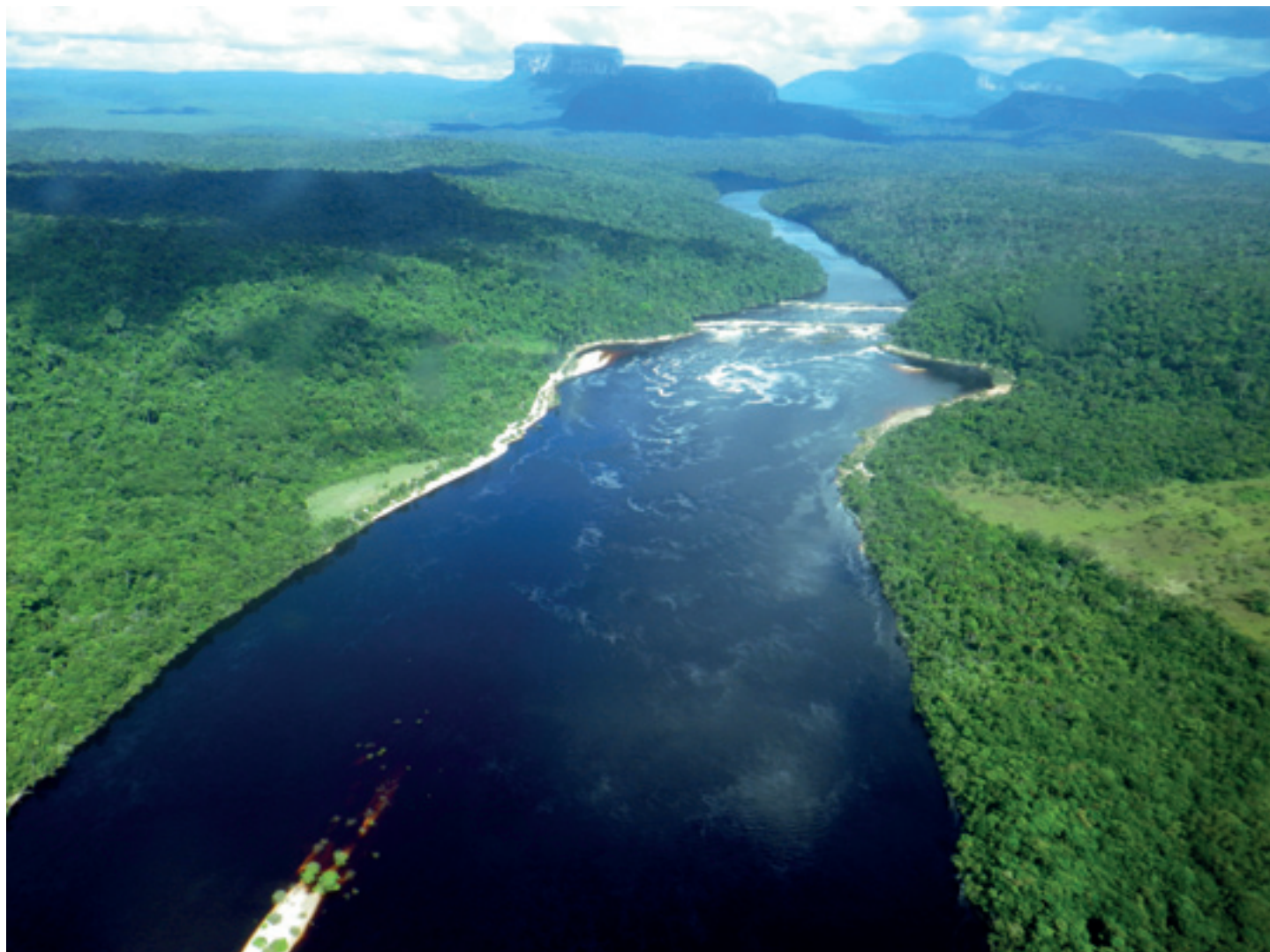
Řeka Orinoko ve Venezuele

je doslova kopií Amsterdamu. Jinak je zde velmi drahá a samé hotelové resorty. Rychle tedy odplouvám na Arubu a ta je jednoznačně nejhorším ostrovem souostrovní. Celou jižní část zabírá obrovská rafinérie a na severní polovině jsou zase samé hotely, bary, značkové obchody a kasina. Já se zde zdržím pouze dvě hodiny pro doplnění čerstvých zásob a rychle odplouvám pryč.