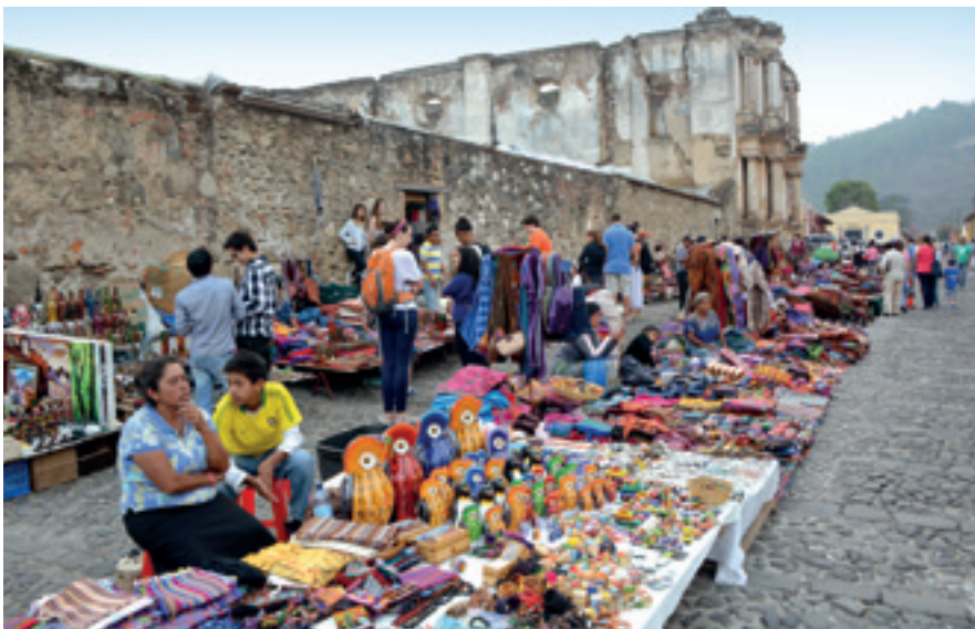
Trh ve městě Antiqua