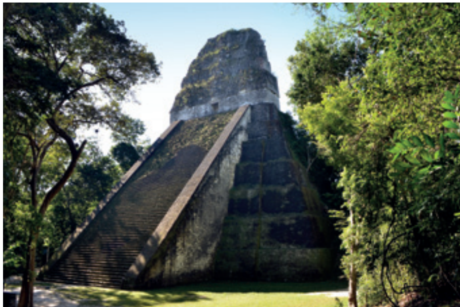
Mayské pyramidy v Tikalu

Druhým a největším ostrovem je Roatan, který je již značně turistický. Dokonce je zde i malá česká vesnice, kde si několik Čechů staví domy k bydlení nebo jen na rekreaci. Pluje sem také mnoho jachtařů, protože je tady bezpečněji než na honduraské pevnině. Posledním karibským ostrůvkem Hondurasu je Utila. Ten je ob-