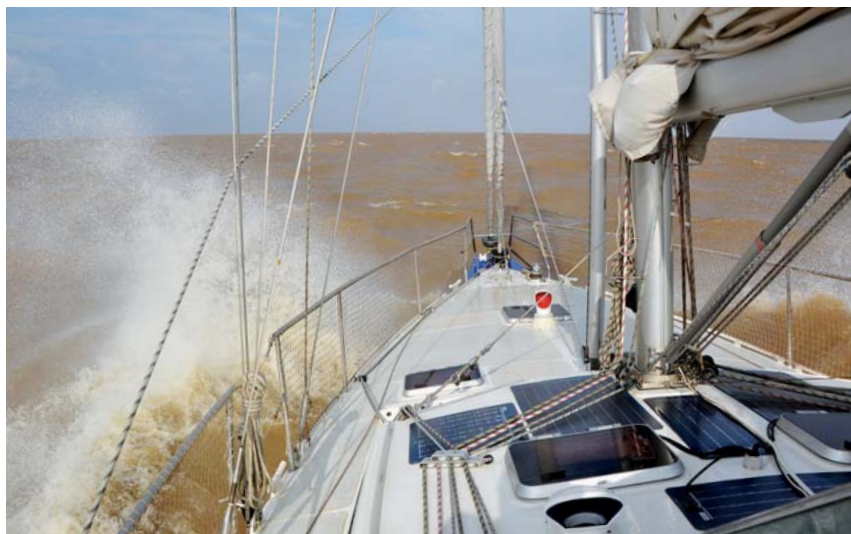
Z Amazonky zpět na oceán