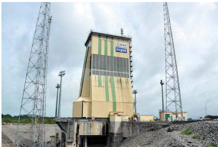
Odpalovací rampa Sojuz

5. 1. vyplouváme severním ramenem Amazonky směrem k deltě. Večer ještě zakotvíme v bočním přítoku, to jsme již 40 mil od oceánu. Ráno s prvními paprsky pokračujeme do delty a severovýchodním kurzem se probíjíme proti větru a zdvíhající se vlnám. Plout přímo na sever podél pobřeží není možné, protože je zde hloubka kolem 3 m. Musíme 100 mil motorovat do oceánu, než lze pomalu točit kolem mělčin na západ. Protivlny jsou vysoké kolem dvou metrů, ale v jednom místě byly určitě třímetrové a občas nás zalily přes palubu. Nejkritičtější místo bylo asi 50 mil od pobřeží. Nejdříve jsme se ocitli na hloubce 2 m, a když jsem hledal cestu zpět na hlubokou vodu, byli jsme již na hloubce 1,8 m. Celou dobu jsme samozřejmě na hnědé špinavé vodě, ta nás bude provázet ještě hodně dlouho.