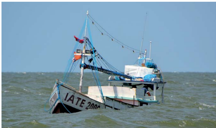
Rybáři na řece Pará