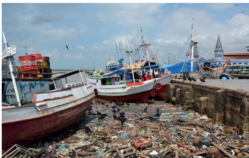
Rybářský přístav v Belému

K tomu další tuňák v lednici a přibližující se pobřeží. Pouze mne zlobí odsolovač, který jsem poprvé nastartoval v Mindelu a krásně pracoval. Jsme již skoro bez vody a měl jsem v plánu naplnit si nádrže, než vplujeme na špinavou řeku. Ani po dvou dnech se mi jej však nepodařilo opravit.