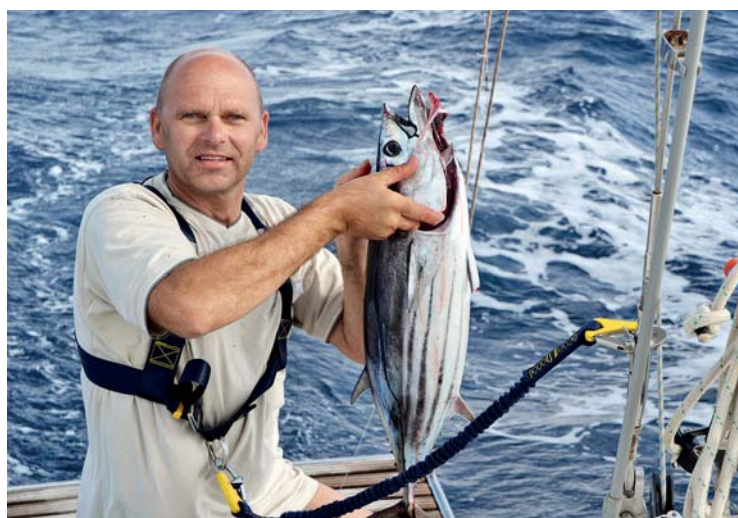
První tuňák na Atlantiku

kteří jim házíme. Zkoušel jsem naše strážce přemluvit, aby se schovali do salonu a teprve v případě nebezpečí zasáhli. Pořád jsem totiž nevěřil pirátskému problému. Jenže mi oba vysvětlili, že jestli chceme chránit, je lepší prevence. Pokud piráti připlují až k lodi, už může být pozdě. Obvykle útočí ve čtyřech a střílí bez vyzvání. Rejž prý již dva piráty zastřelil a nechce to opakovat. Vřak také když se objeví na dohled nějaká loďka, okamžitě zpozorní a vystavují na odív svoje zbraně. Musel jsem tedy uznat jejich argumenty. Naštěstí k nám však připlouvají pouze děti nebo potkáváme místní obchodníky s ovocem. Břehy lemují palmy a desítky dalších druhů stromů porostlých liánami. Občas mezi stromy stojí na ků-