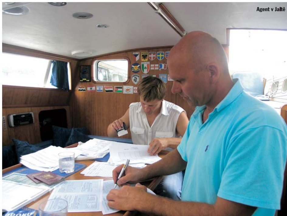
Agent v Jaltě