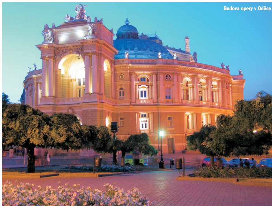
Budova opery v Oděse

V úterý odpoledne se ptám v kanceláři mariny na celní odbavení. Chceme ve středu vyplout, takže bych nejraději vše již připravil s předstihem. Agentu prý potřebovat nebudu,