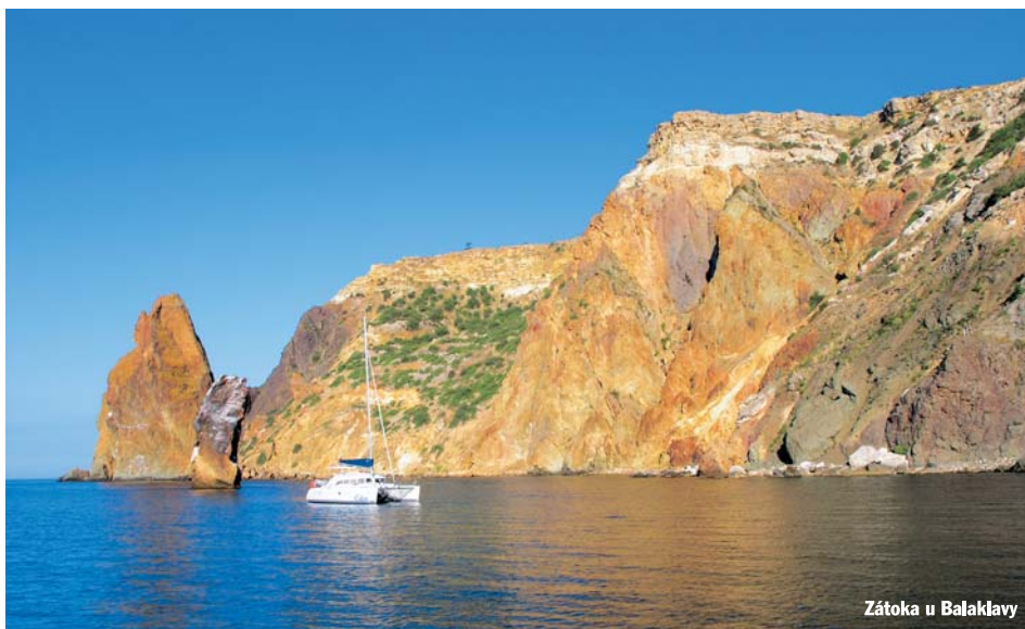
Zátoka u Balaklavy

V pondělí nám agent slavnostně donesl všechny potvrzené doklady a rovněž mi nabídl vystavení jakéhosi povolení pro plavbu. Na Ukrajině totiž musíte mít povolení od pohraničnicků plout z jednoho přístavu do druhého. A v dalším se opět přihlásit a požádat o další plavbu. Nám za 200 USD vystavili jakýsi doklad, který nás opravňoval plout bez těchto procedur. Při opuštění přístavu je třeba se ohlásit pohraničnickům a informovat je o vyplutí a cíly cesty. Během plavby si vás pak předávají podle jednotlivých úseků a neustále vás někdo volá a ptá se, kdo jste a kam plujete. Pokud zastavíte na kotvě, opět vás volají, co tam děláte. Vše sledují na radarech a každou loď mají dokonale pod kontrolou.