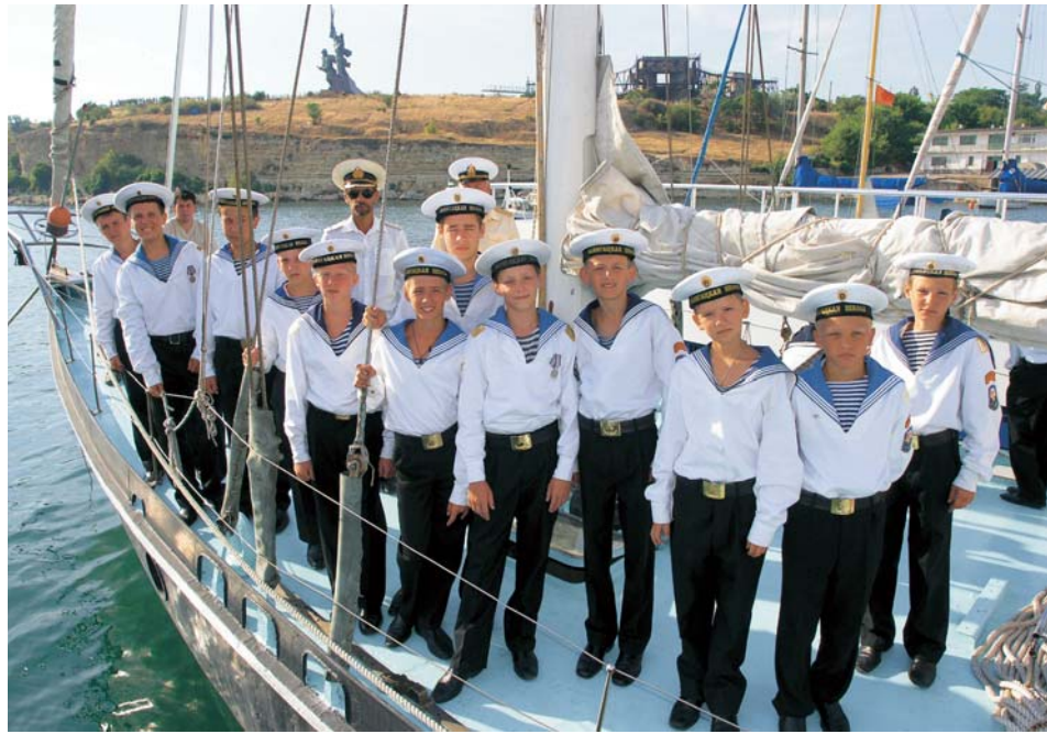
Kadeti ruského námořnictva

Asi 4 míle západně od Balaklavy jsme objevili jedinou zátoku na Krymu, kde se dalo kotvit přes noc. Vysoké útesy poskytují dokonalou ochranu a samostatné skály vystupují z moře jako žraločí zuby. Přes den je tu hodně živo, protože zde kotví výletní lodě s turisty, ale večer byl úžasný a hlavně klidný. Hned za rohem je přístav Sevastopol. Kotvíme v jachtařském klubu vedle staré ocelové jachty. Je z roku 1938 a patřila německému pohlaváři Goeringovi. Po válce byla zabavena ruskou armádou v rámci reparací a dnes slouží k výuce námořních kadetů. V Sevastopolu je ještě dnes sídlo ruské vojenské flotily a celé město je typicky ruské. Všude jsou památníky z válek, busty Lenina či rudé hvězdy a ruské prapory na domech. Většina obyvatel se totiž cítí být Rusy. Ve městě se nemluví ukrajinsky, ve školách odmítají vyučovat ukrajinštinu. Ruská válečná flotila zde má být do roku 2017 a většina obyvatel se tohoto termínu obává. Až odejdou vojáci, začnou problémy. Na ruské armádě je totiž závislých mnoho obyvatel, ať jako civilních zaměstnanců či různých dodavatelů