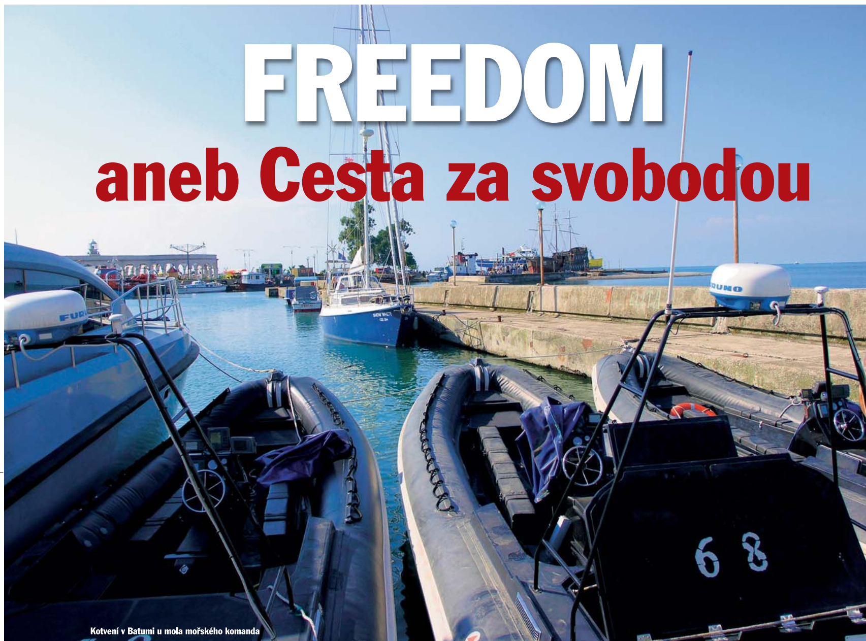
Kotvení v Batumi u mola mořského komanda