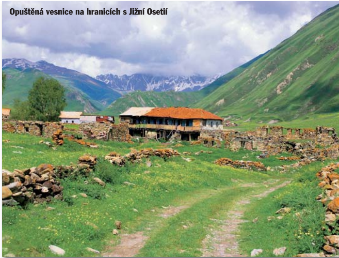
Opuštěná vesnice na hranicích s Jižní Osetií