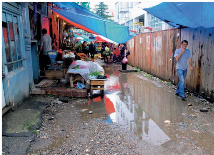
Kontrasty v Batumi