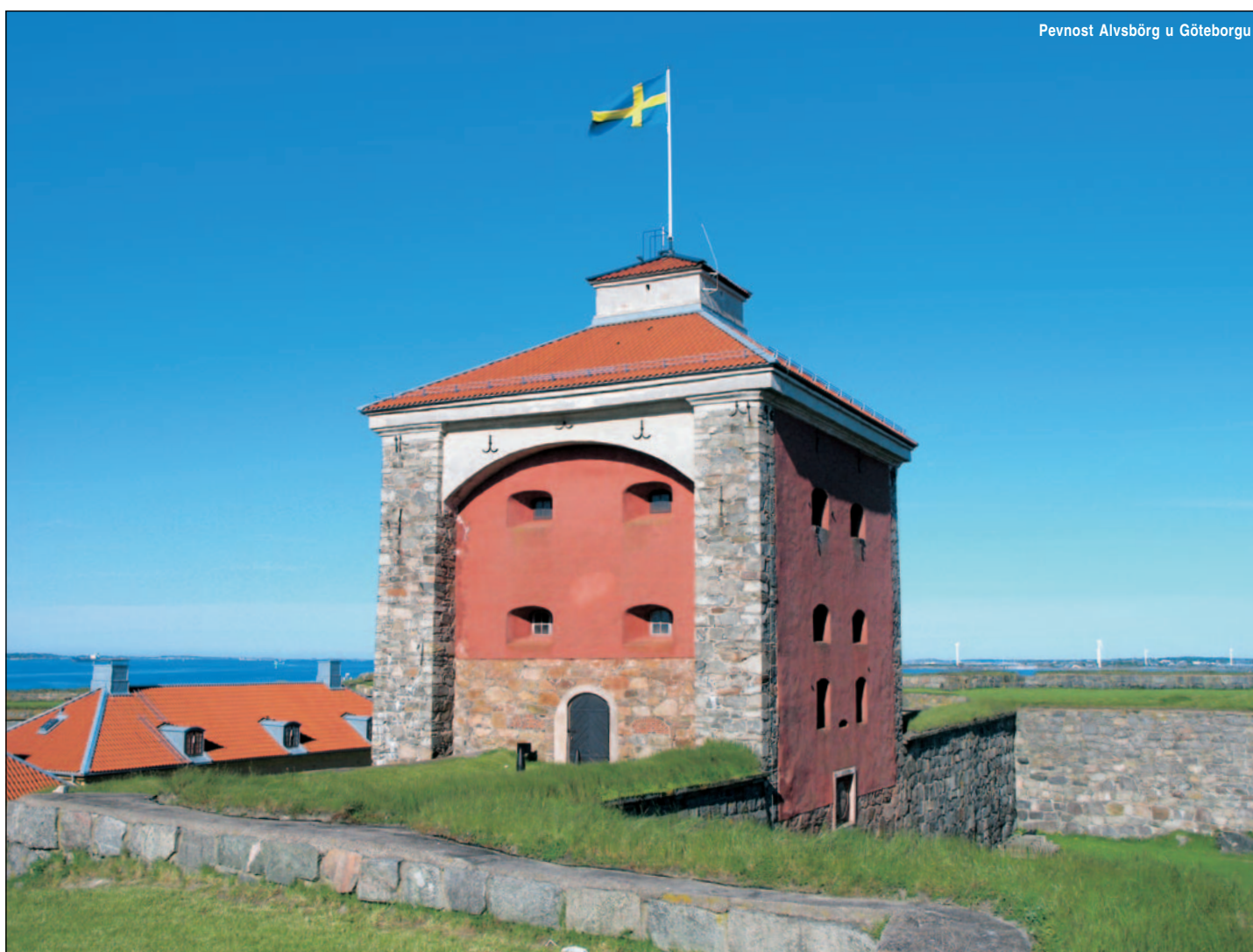
Pevnost Alvsborg u Göteborgu

Rodinné domky jsou většinou ze dřeva s vzorně upravenými zahrádkami a krásně září barvami. Z ostrova Anholt jsme upluli 60 Nm a do Göteborgu jich zbývá ještě asi 40. Ráno tedy opět vyrážíme brzy a otevřené moře nás vítá svěžím západním větrem a modrou oblohou. Takhle si nadjedeme až k ostrůvku Matskarsb, okolo kterého po přehození geny však musíme zrefovat, protože vítr již dosahuje v nárazech 30 uzlů. Přesto se nám podařilo vytrimovat plachty tak, že jedeme rychlostí 8,4 uzlu. To jsme již v plavební dráze a míříme na Göteborg. Zde však musíme naši velkou genu, která je velmi náročná na přehazování, zarolovat, protože musíme křížovat v plavební dráze. Vytahujeme samo-přehazovací kosatku, s jejíž pomocí krásně stoupáme mezi loděmi až do přístavu Langedrak, což je marina na předměstí Göteborgu. Dnešní log ukazuje 55 Nm. V Göteborgu máme v plánu prohlídku města. Navštívili jsme zde námořní muzeum, kde se nám naskytlá příležitost prohlédnout si švédskou ponorku.