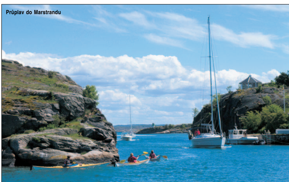
Průplav do Marstrandu

obloha, tak strážní věž pevnosti září svou červenou barvou. Po prohlídce pevnosti vyplouváme na plachty mezi příbřežní ostrůvky a dnešním cílem je ostrůvek Marstrand. Příjezd volíme úžinou mezi ostrůvkem Köon. Tato úžina je v nejužším místě široká pouze