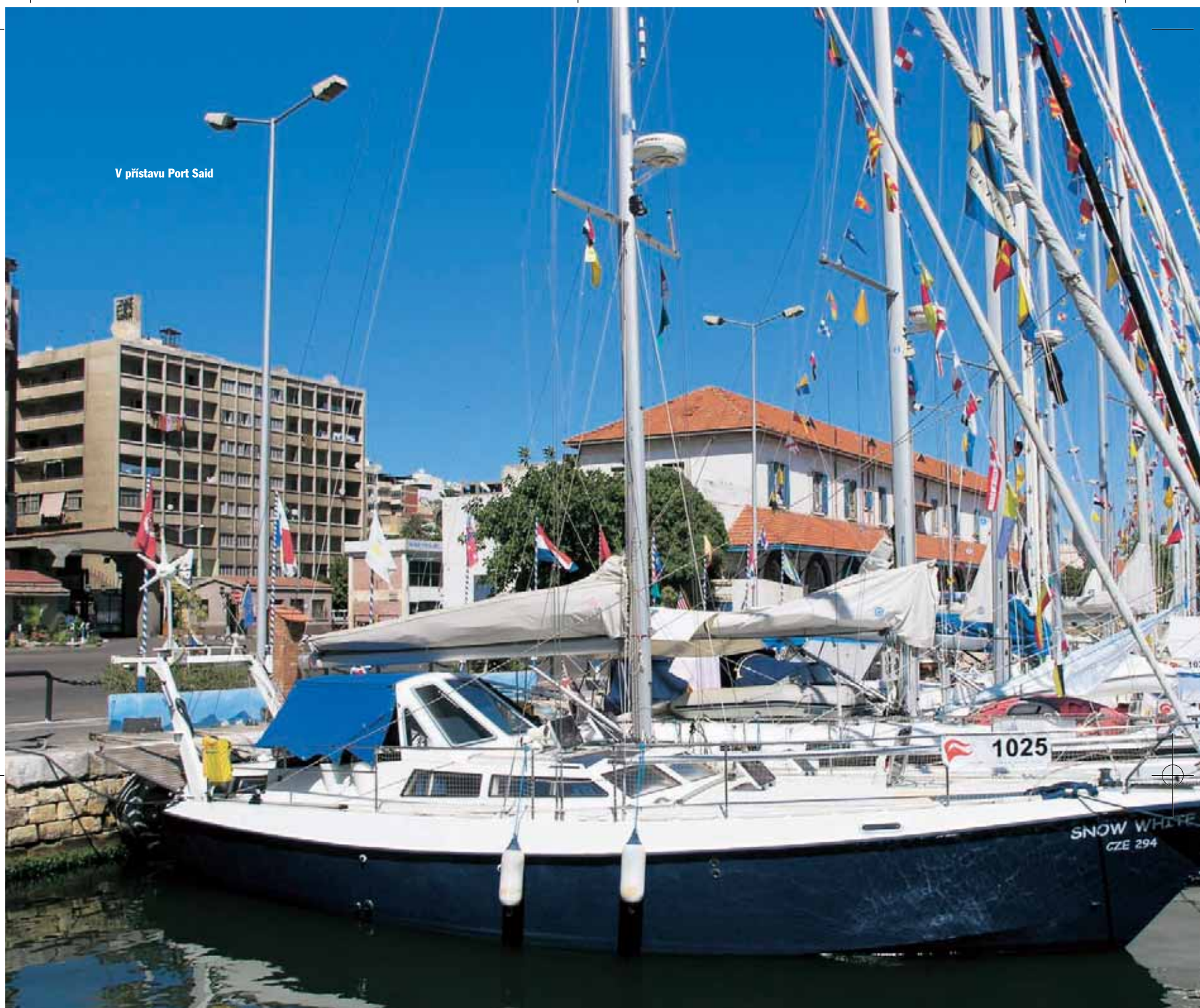
V přístavu Port Said