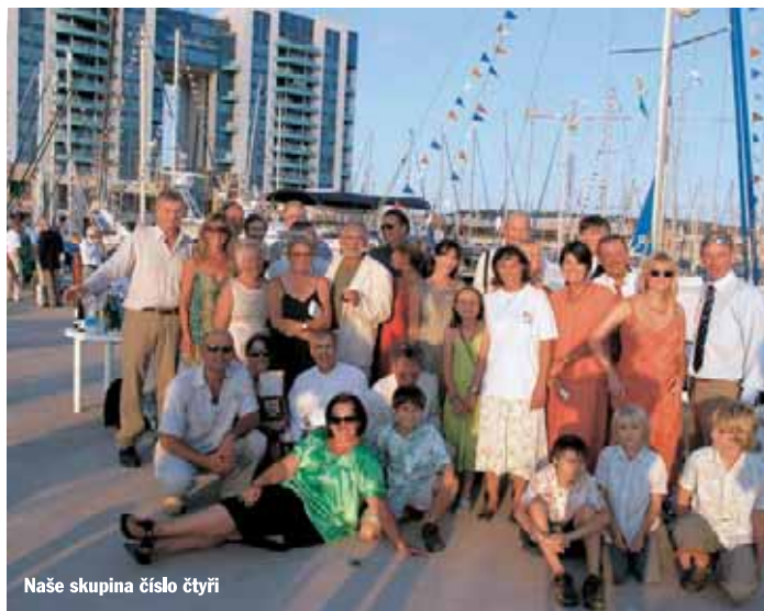
Naše skupina číslo čtyři